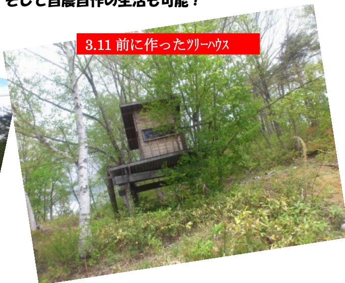
3.11 前に作ったツリーハウス