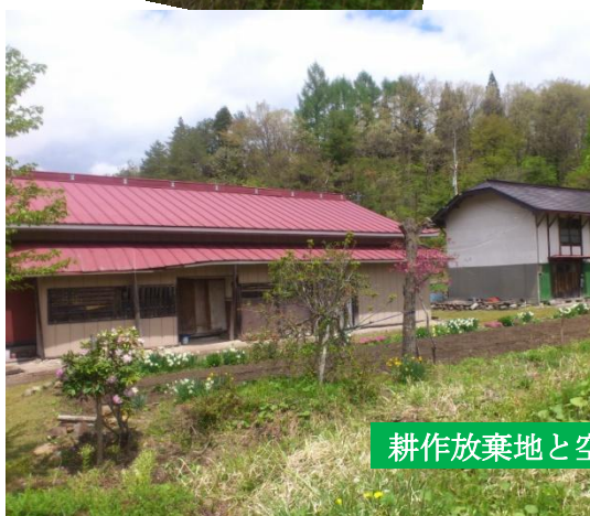
耕作放棄地と空き家