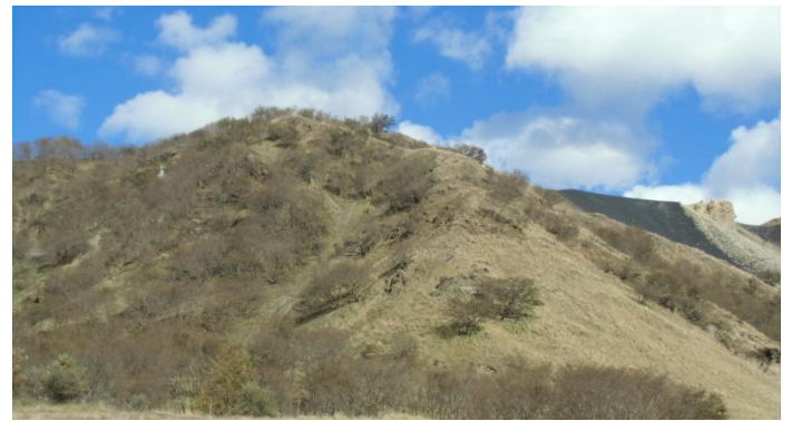
地元の人々は戦後、ここは何の違和感もなく日本のグランドキャニオンと称していた。